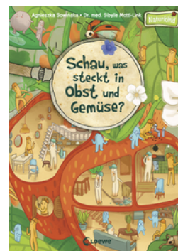
Schau, was steckt in Obst und Gemüse?