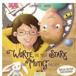
Worte, die mich stark und mutig machen