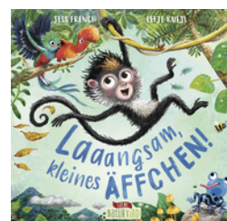
Laaangsam, kleines Äffchen!