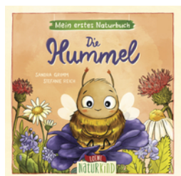
Mein erstes Naturbuch - Die Hummel