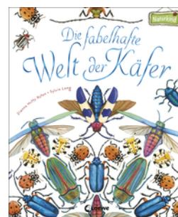
Die fabelhafte Welt der Käfer