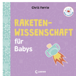
Baby-Universität - Raketenwissenschaft für Babys