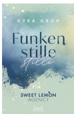
Funkenstille (Sweet Lemon Agency, Band 3)