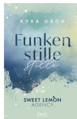
Funkenstille (Sweet Lemon Agency, Band 3)