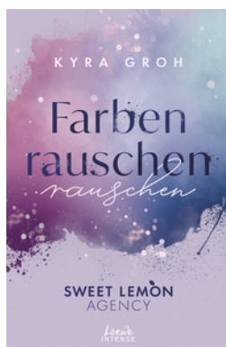
Farbenrauschen (Sweet Lemon Agency, Band 2)