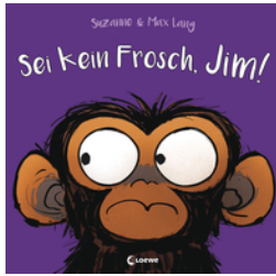
Sei kein Frosch, Jim!