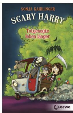
Scary Harry (Band 2) - Totgesagte leben länger