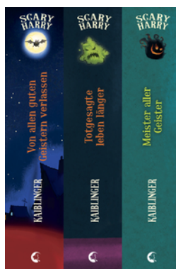
Scary Harry (Band 1-3)