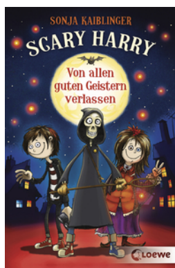
Scary Harry (Band 1) - Von allen guten Geistern verlassen