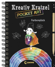
Kreativ-Kratzel Pocket Art: Farbenglück