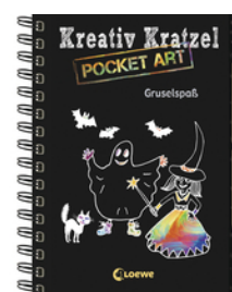
Kreativ-Kratzel Pocket Art: Gruselspaß