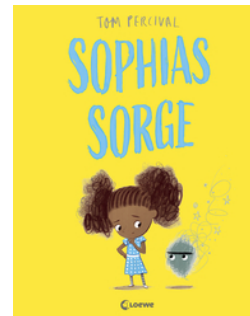
Sophas Sorge (Die Reihe der starken Gefühle)