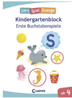
Die neuen LernSpielZwerge - Erste Buchstabenspiele