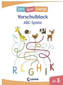
Die neuen LernSpielZwerge - ABC-Spiele