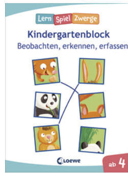
Die neuen LernSpielZwerge - Beobachten, erkennen, erfassen