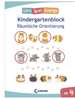
Die neuen LernSpielZwerge - Räumliche Orientierung