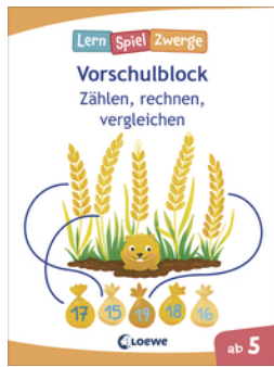
Die neuen LernSpielZwerge - Zählen, rechnen, vergleichen