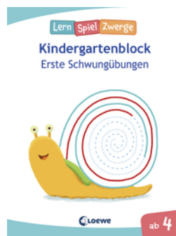
Die neuen LernSpielZwerge - Erste Schwungübungen