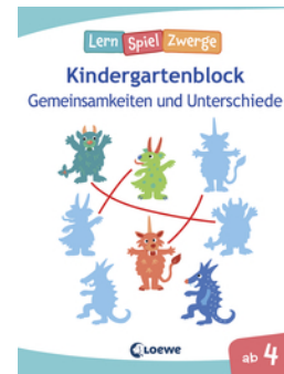
Die neuen LernSpielZwerge - Gemeinsamkeiten und Unterschiede