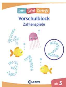
Die neuen LernSpielZwerge - Zahlenspiele