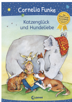
Katzenglück und Hundeliebe