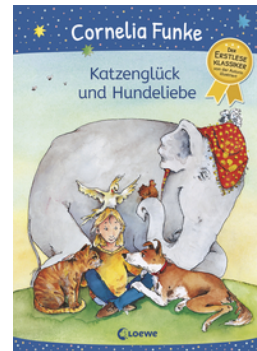
Katzenglück und Hundeliebe