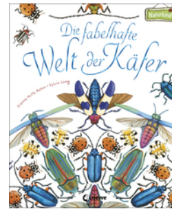
Die fabelhafte Welt der Käfer