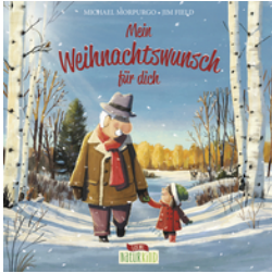
Mein Weihnachtswunsch für dich