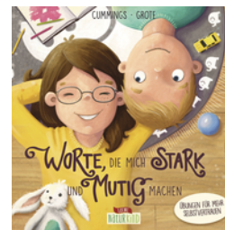
Worte, die mich stark und mutig machen