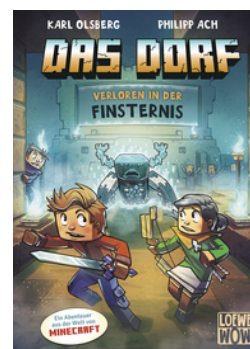
Das Dorf (Band 6) - Verloren in der Finsternis