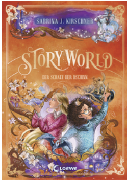
StoryWorld (Band 3) - Der Schatz der Dschinn