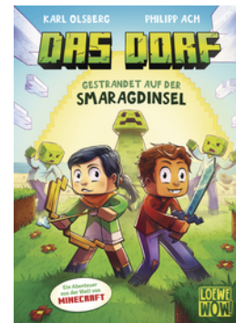
Das Dorf (Band 1) - Gestrandet auf der Smaragdinsel