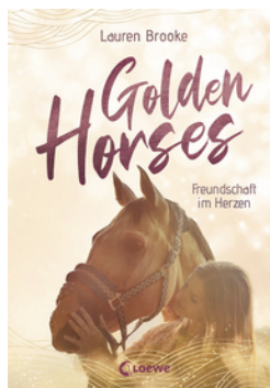
Golden Horses (Band 3) - Freundschaft im Herzen