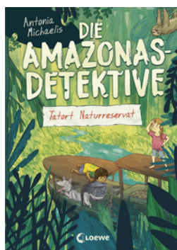
Die Amazonas-Detektive (Band 2) - Tatort Naturreservat