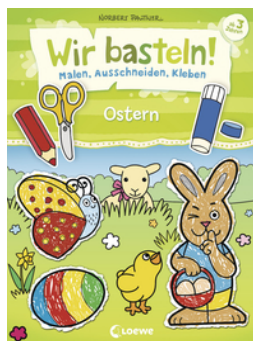
Wir basteln! - Malen, Ausschneiden, Kleben - Ostern