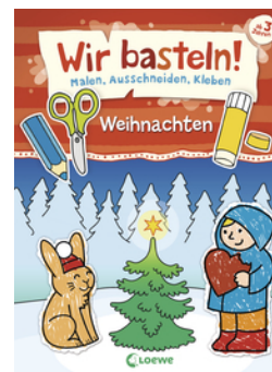
Wir basteln! - Malen, Ausschneiden, Kleben - Weihnachten