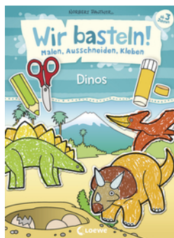
Wir basteln! - Malen, Ausschneiden, Kleben - Dinos