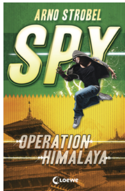
SPY (Band 3) - Operation Himalaya