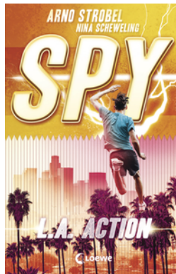
SPY (Band 4) - L.A. Action