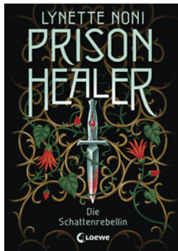
Prison Healer (Band 2) - Die Schattenrebellin