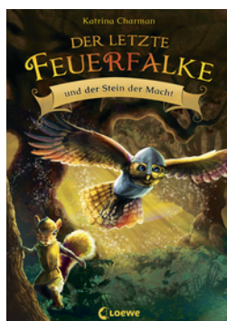
Der letzte Feuerfalte und der Stein der Macht (Band 1)