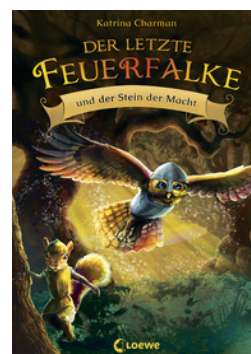
Der letzte Feuerfalte und der Stein der Macht (Band 1)