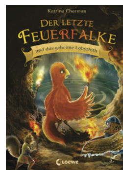
Der letzte Feuerfalke und das geheime Labyrinth (Band 10)