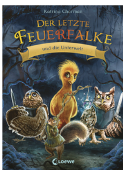
Der letzte Feuerfalke und die Unterwelt (Band 11)