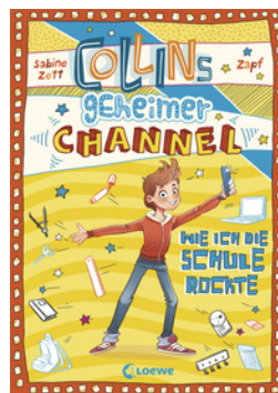
Collins geheimer Channel (Band 2) - Wie ich die Schule rockte