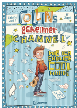
Collins geheimer Channel (Band 1) - Wie ich endlich cool wurde