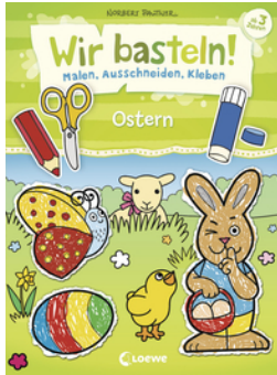
Wir basteln! - Malen, Ausschneiden, Kleben - Ostern