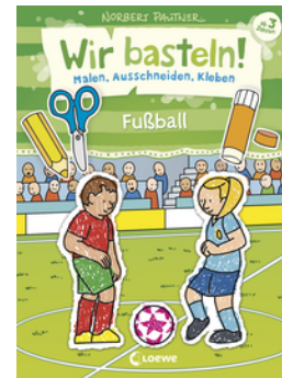
Wir basteln! - Malen, Ausschneiden, Kleben - Fußball