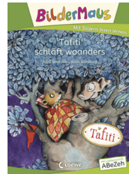
Bildermaus - Tafiti schläft woanders