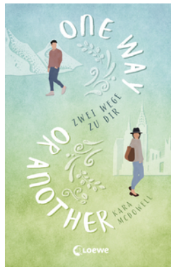
One Way Or Another