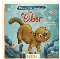
Mein erstes Naturbuch - Der Biber