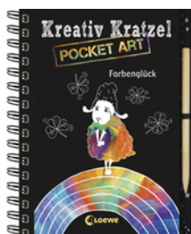
Kreativ-Kratzel Pocket Art: Farbenglück