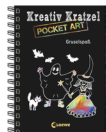
Kreativ-Kratzel Pocket Art: Gruselspaß