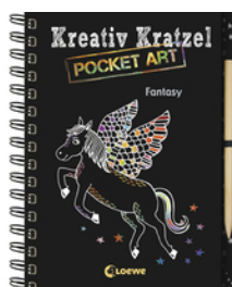
Kreativ-Kratzel Pocket Art: Fantasy