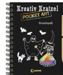
Kreativ-Kratzel Pocket Art: Gruselspaß