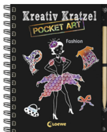
Kreativ-Kratzel Pocket Art: Fashion