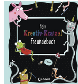
Mein Kreativ-Kratzel Freundschaftsbuch