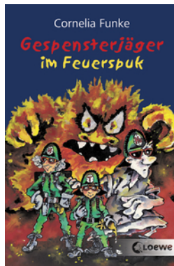
Gespensterjäger im Feuerspuk