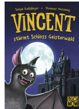
Vincent stürmt Schloss Geisterwald (Band 4)