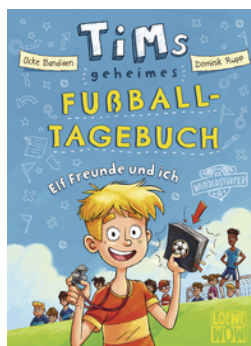
Tims geheimes Fußball- Tagebuch (Band 1) - Elf Freunde und ich!