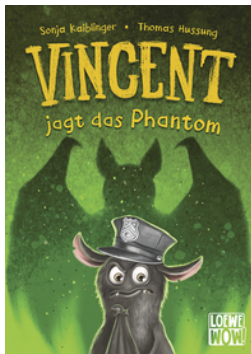
Vincent jagt das Phantom (Band 5)