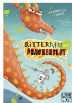
Rittermut und Drachenblut