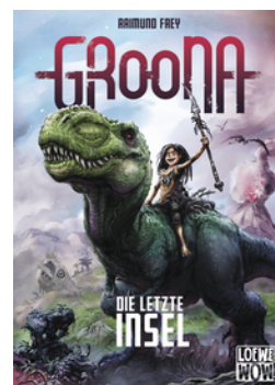
Groona - Die letzte Insel