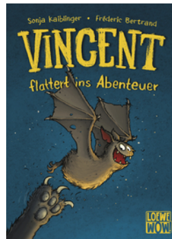
Vincent flattert ins Abenteuer (Band 1)