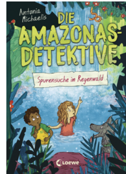
Die Amazonas-Detektive (Band 3) - Spurensuche im Regenwald