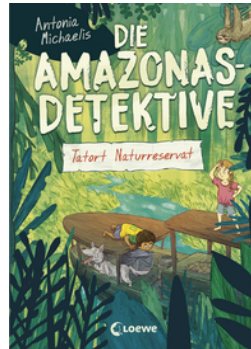
Die Amazonas-Detektive (Band 2) - Tatort Naturreservat