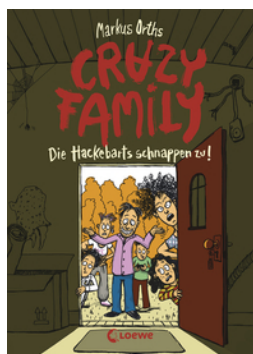
Crazy Family (Band 2) - Die Hackebarts schnappen zu!