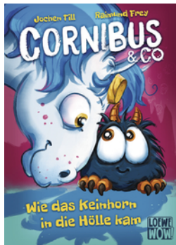
Cornibus & Co. (Band 4) - Wie das Keinhorn in die Hölle kam