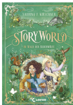
StoryWorld (Band 2) - Im Wald der Silberwölfe