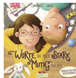
Worte, die mich stark und mutig machen