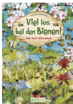
Viel los bei den Bienen!