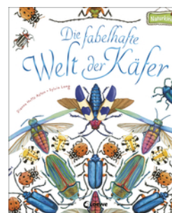
Die fabelhafte Welt der Käfer