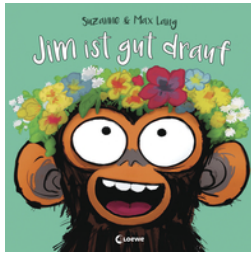
Jim ist gut drauf