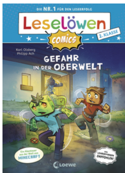
Leselöwen Comics 2. Klasse - Gefahr in der Oberwelt