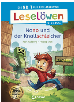
Leselöwen 2. Klasse - Nano und der Knallschleicher