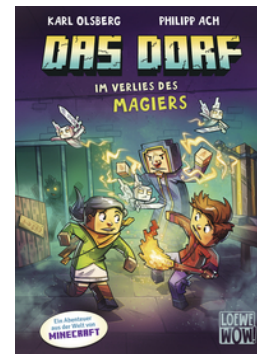
Das Dorf (Band 7) - Im Verlies des Magiers