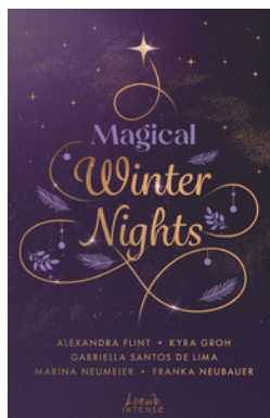
Magical Winter Nights