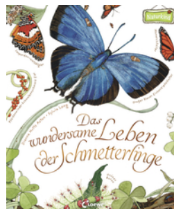
Das wundersame Leben der Schmetterlinge