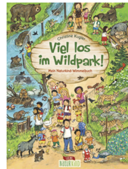
Viel los im Wildpark!