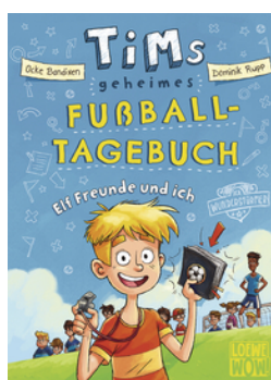
Tims geheimes Fußball- Tagebuch (Band 1) - Elf Freunde und ich!