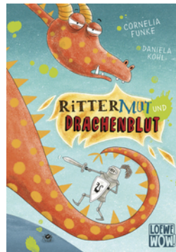
Rittermut und Drachenblut