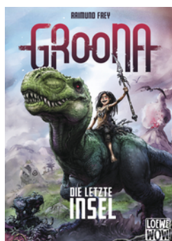
Groona - Die letzte Insel