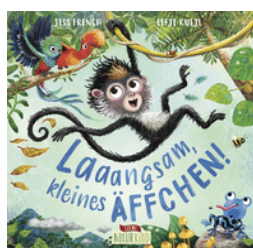
Laaangsam, kleines Äffchen!