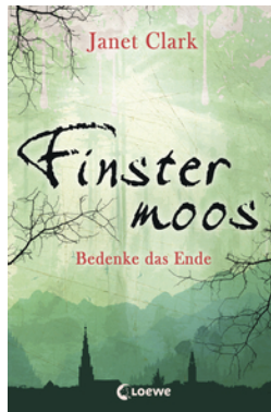
Finstermoos – Bedenke das Ende