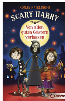
Scary Harry (Band 1) - Von allen guten Geistern verlassen