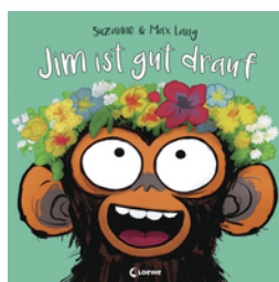
Jim ist gut drauf