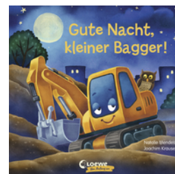
Gute Nacht, kleiner Bagger!