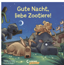
Gute Nacht, liebe Zootiere!