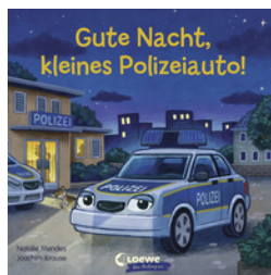
Gute Nacht, kleines Polizeiauto!