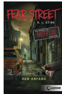
Fear Street - Der Anfang