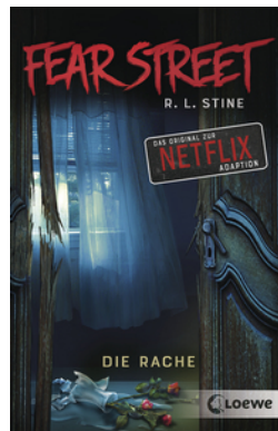
Fear Street - Die Rache