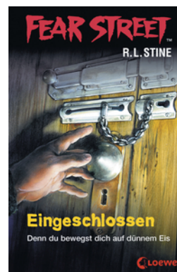
Fear Street 53 - Eingeschlossen