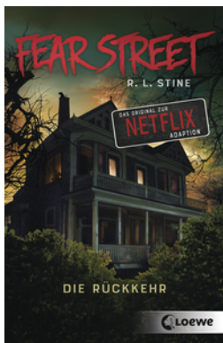
Fear Street - Die Rückkehr