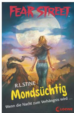
Fear Street 57 - Mondsüchtig