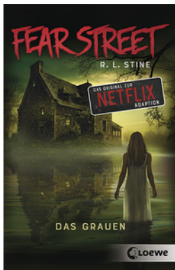
Fear Street - Das Grauen