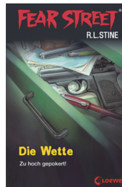
Fear Street 56 - Die Wette