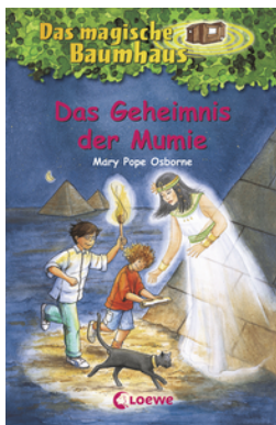
Das magische Baumhaus (Band 3) - Das Geheimnis der Mumie