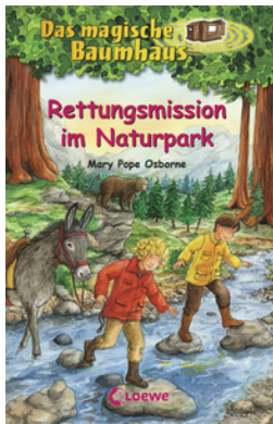
Das magische Baumhaus (Band 59) - Rettungsmission im Naturpark