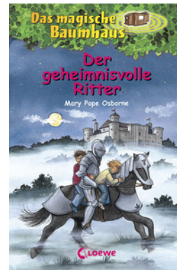
Das magische Baumhaus (Band 2) - Der geheimnisvolle Ritter