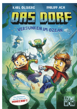
Das Dorf (Band 5) - Versunken im Ozean