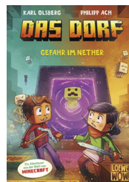
Das Dorf (Band 2) - Gefahr im Nether