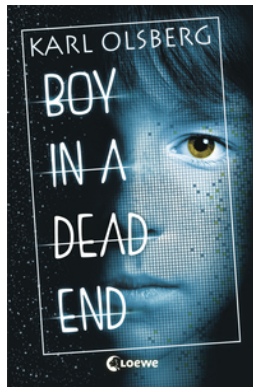
Boy in a Dead End