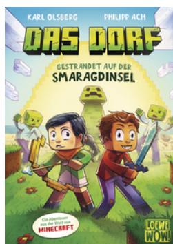
Das Dorf (Band 1) - Gestrandet auf der Smaragdinsel