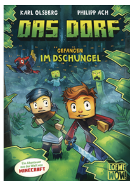
Das Dorf (Band 3) - Gefangen im Dschungel