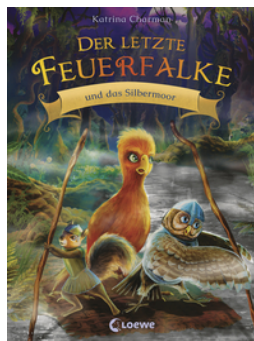
Der letzte Feuerfalke und das Silbermoor (Band 8)